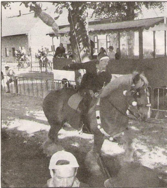
Een vrouwelijke gansrijder rijdt onder de ganzekop door. De dames reden niet alleen voor de eer van de koninginnetitel, hun wedstrijd bracht ook meer dan 300.000 frank op voor de vzw Breek de Stilte.

Gewoontegetrouw werd het gansrijden afgesloten met een grootse fuif, die zondagochtend pas om halfzeven eindigde.